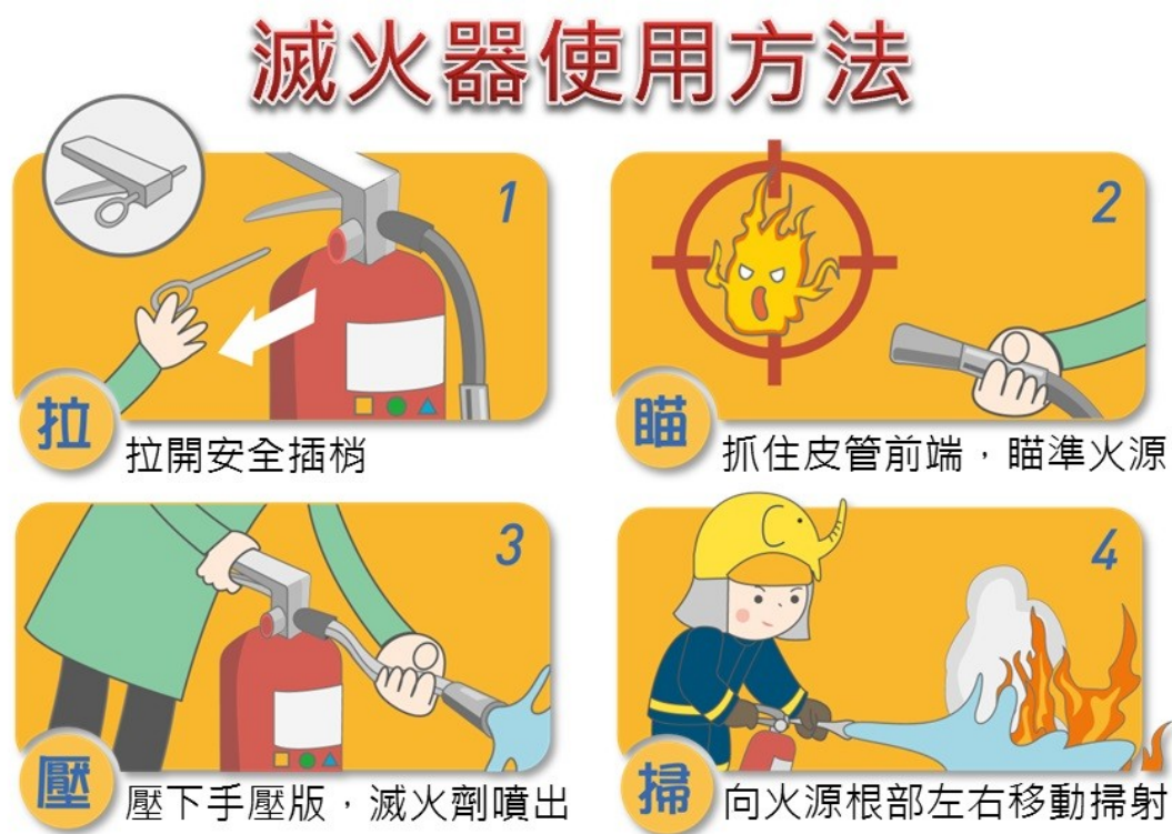
圖 6：滅火器使用方法

內政部消防署再次提醒您，使用滅火器時請熟記 4 字訣：「拉-拉插梢、瞄-瞄準火源底部、壓-壓握把、掃-向火源左右掃射」（如圖 6）。