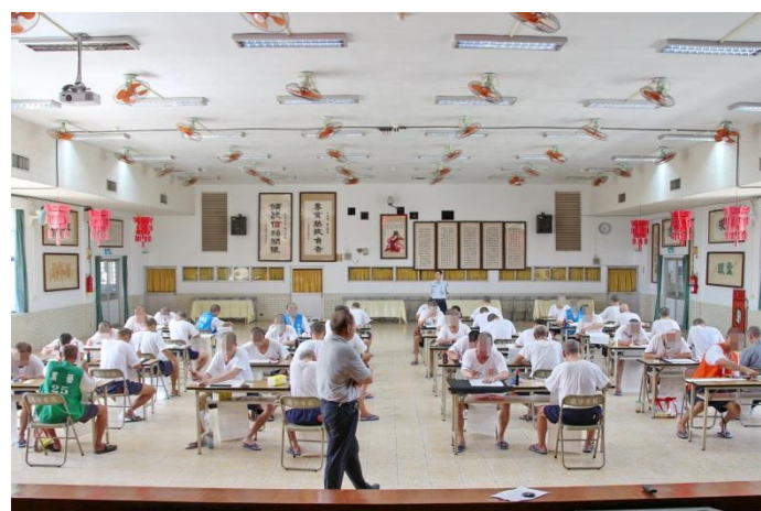
書法比賽活動情形