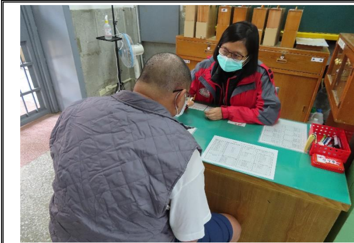
無犯罪促進會黃指導員進行轉銜評估