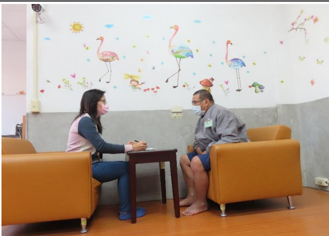
社工師評估受戒治人家庭關係及出監需求

雇主張老闆前為更生人，106年自本監出監後成為無犯罪促進會反毒講師，積極從事國小反毒宣導，取得電焊甲級技術士證並自行創業成立工程行，對出監更生人極為支持，希望以過來人身分協助收容人，給予就業機會，在穩定就業的路途中陪伴啟動內在動力、點亮幸福人生。