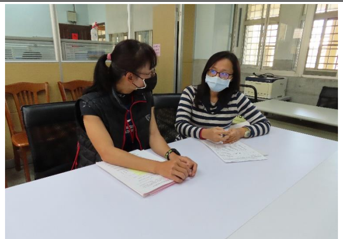
本監社工師與無犯罪促進會林督導討論個案狀態