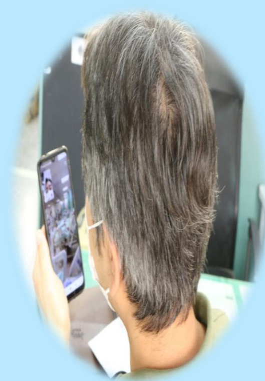
戒護住院同仁協助戶政事務 所人員視訊核對受刑人身分