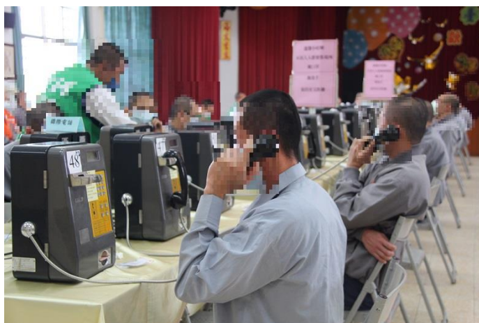
收容人關懷家屬互道平安

疫情來勢洶洶，收容人甚為擔心家屬在外防護措施是否到位，電話懇親現場不時傳來「第三劑疫苗預約了沒？」、「現在新變種病毒Omicron傳染越來越嚴重，儘量不要出門」等對家人的提醒與擔憂，本監教化科特別製作紅色溫馨標語豎立於電話旁，提醒收容人轉知家屬配合中央流行疫情指揮中心防疫措施，不出入人群聚集處所、戴口罩、勤洗手、保持社交距離…，全民一起防疫，同時也彌補收容人春節無法與家人團圓的缺憾與思鄉之愁。