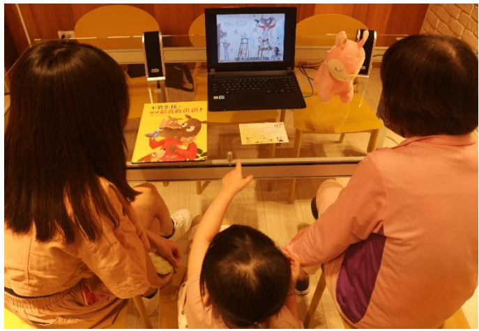
女兒天真地喊著：「那是爸爸!那是爸爸!」