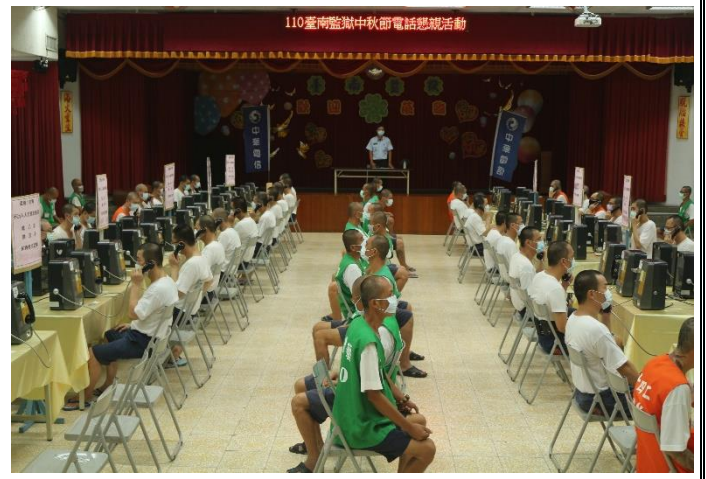
中秋節收容人電話懇親情形