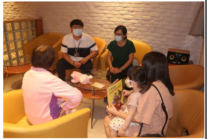
母親含淚地說：「希望他出監能有所改變」