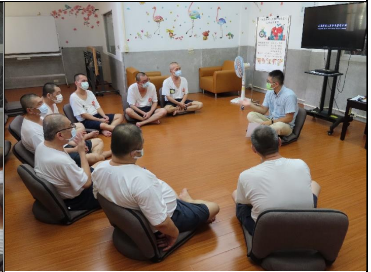
成員分享觀賞紀錄片心得