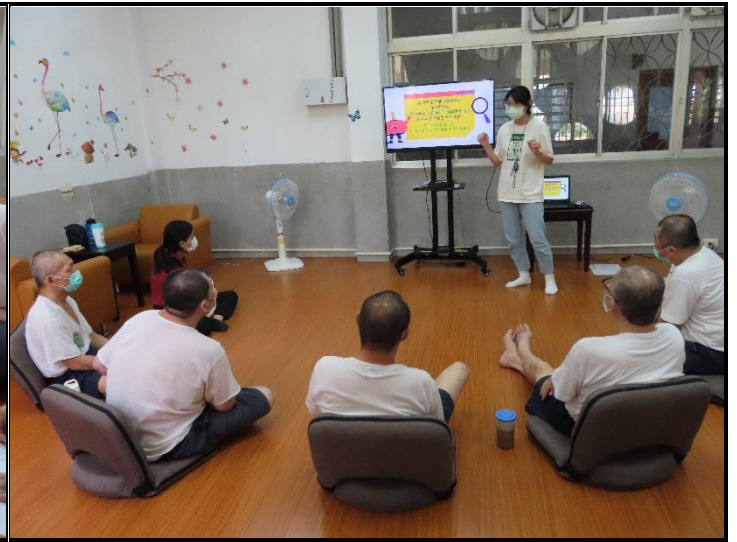
社工人員講解社會資源