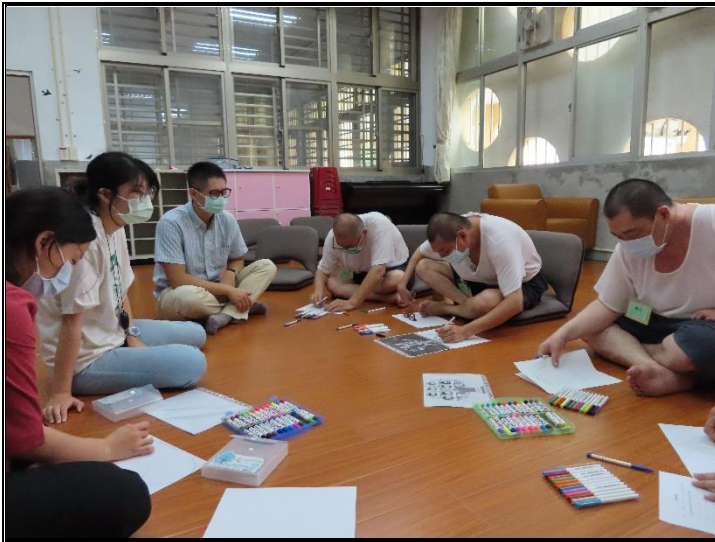
成員繪製「我的家庭樹」