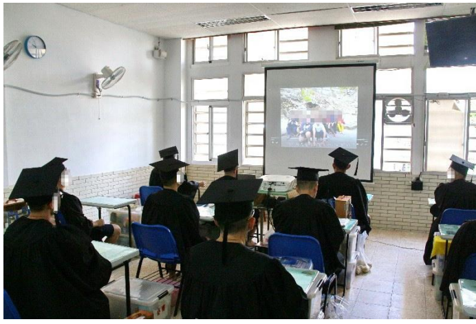
畢業生觀看家屬傳送的鼓勵影片